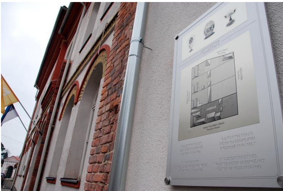
Fabergé nimele pühendatud mälestustahvel Vana Tallinna tänaval